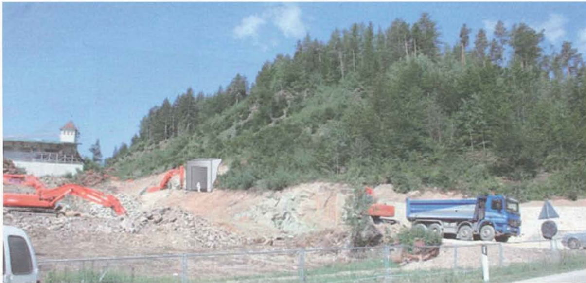
Versenktes Projekt Pumpspeicherwerk (geplanter Stolleneingang in Klobenstein, Montage): „Kelag“ und „WEB Windenergie AG“ ziehen sich zurück.